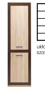
BS 9 - szafka →/↗/↖/↑ 55/35,5/198