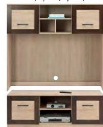
BS 2 - szafka RTV →/↗/↖/↑ 135,5/52,5/49