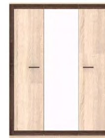
BS 22 –szafa 3D z lustrem →/↗/↖/↑ 149,8/52/197,8