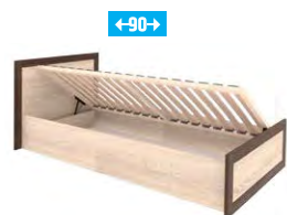
BS 19/90 –łóżko 90 z pojemnikiem i stelażem →/↗/↖/↑ 108/204,2/90