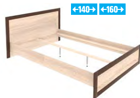
BS 19/140-160 –łóżko 140-160 bez stelaża →/↗/↖/↑ 158-178/204,2/90