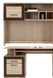
BS 11 - biurko →/↗/↖/↑ 120/54,5/76,5