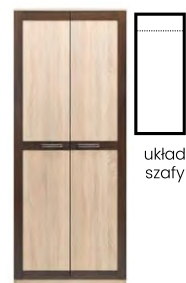
BS 10 - szafa 2D →/↗/↖/↑ 80/52,5/198