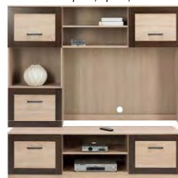
BS 4 - szafka RTV →/↗/↖/↑ 175/52,5/49