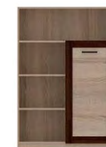
BS 18 - regał →/↗/↖/↑ 96/40/142,6