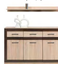
BS 6 - komoda →/↗/↖/↑ 135,5/40,5/89