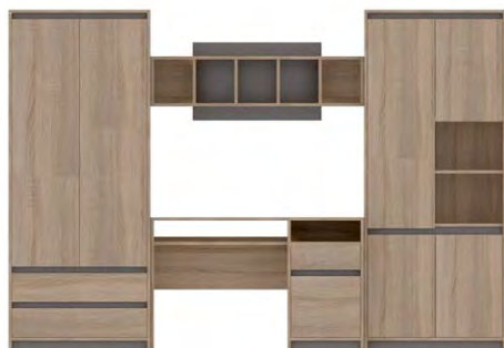
MADAGASKAR II →/↗/↑ 280/53/192,5