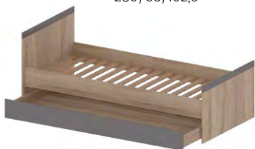
ŁÓŻKO 90 MADAGASKAR łóżko z szufladą i stelażem (lewe/prawe) →/↗/↑ 97,5/204/80