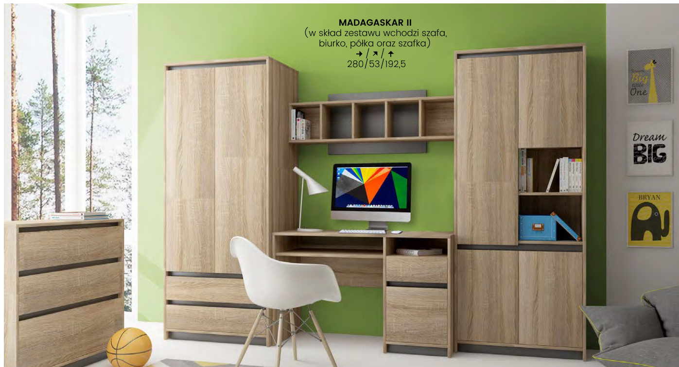
MADAGASKAR II (w skład zestawu wchodzi szafa, biurko, półka oraz szafka) →/↗/↑ 280/53/192,5