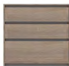
KOMODA MADAGASKAR →/↗/↑ 90/39/86,5