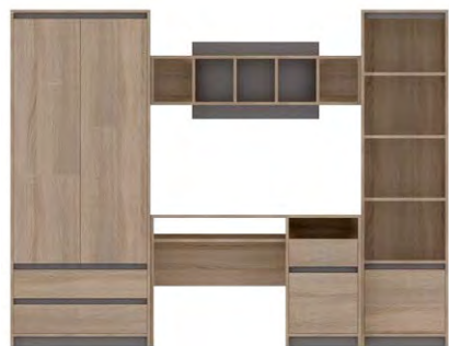
MADAGASKAR I →/↗/↑ 250/53/192,5